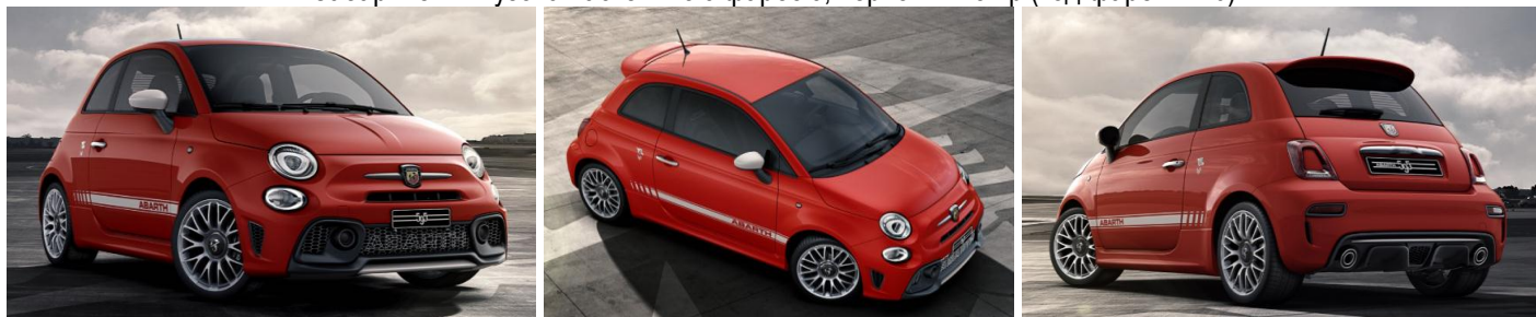
Забарвлення кузова пастельною фарбою, червоний колір (код фарби 176)

Виробник або продавець залишає за собою право зміни комплектацій та цін на автомобілі без попереднього повідомлення.