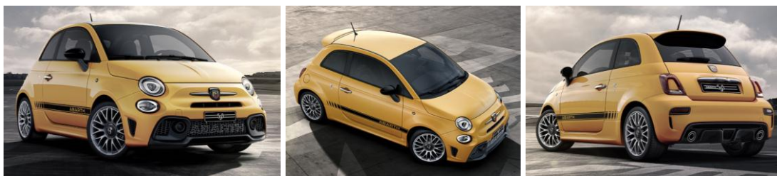
Забарвлення кузова пастельною фарбою жовтого кольору (код фарби 258)

Виробник або продавець залишає за собою право зміни комплектацій та цін на автомобілі без попереднього повідомлення.